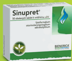
Sinupret 50 tabliet 165,- Sk