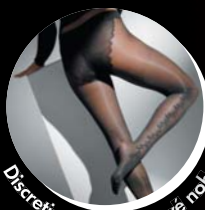
Discretion - pančúchové nohavice