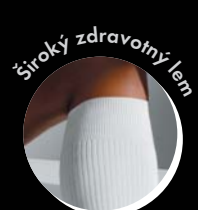
Široký zdravotný lem