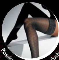
Passion - stehenné pančúčky s krajkou