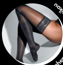
Stehenné pančúčky s krajkou