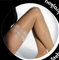
Stehenné pančúčky s krajkou